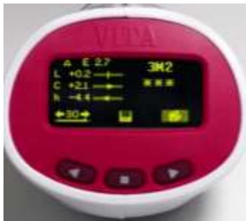
الشكل(2): قيمة التغير اللوني \Delta E المسجلة.