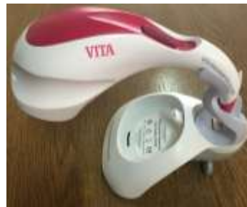
الشكل(1): معايرة جهاز VITA Easyshade® Advance 4.0